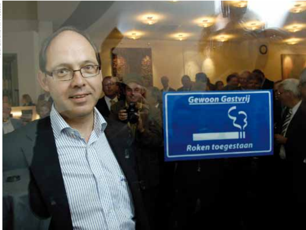
■ Bij de aanvang van het rookverbod is in de sociëteit van het internationaal perscentrum Nieuwspoor een rookruimte ingericht binnen de bestaande ruimte.

horeca) in het geval van rookruimtes aan een minimum aantal eisen voldoen. De ruimte dient afgesloten te zijn en er mag geen hinder zijn van tabaksrook. Ventilatie-eisen zijn er niet, althans niet aanvullend op de minimum ventilatie-eisen die zijn geformuleerd in het bouwbesluit. Elke werknemer heeft het recht op een rookvrije werkplek. Dit recht is te vertalen als een plicht naar de werkgever om ervoor te zorgen dat je nooit ongewenst in de rook hoeft te staan. Dus geen rookruimte op het toilet en ook niet in die nauwelijks gebruikte hoek vlakbij de nooduitgang of het (nood) trappenhuis, en eigenlijk ook niet nabij de entree van een gebouw. De rest van het gebouw mag bovendien geen hinder ondervinden van de tabaksrook in de rookruimte. En daar ontstaat vaak het